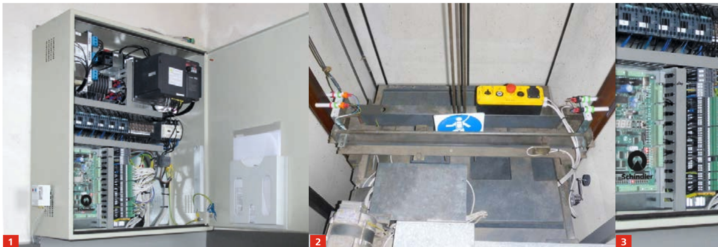
1: Comando na parede | 2: Teto da cabina | 3: Detalhes do Comando

Inclusive começa a dar-se conta que a precisão de paragem, conforto e segurança, já não são os mesmos, nem equivalem ao padrão moderno. Então porque não melhorar o rendimento do seu ascensor?