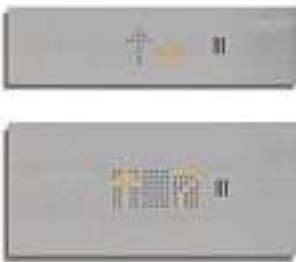
Painel de comando de cabina ▶▶