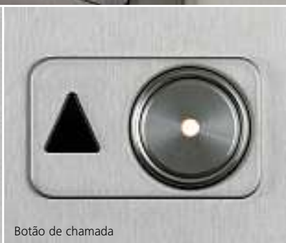
Botão de chamada