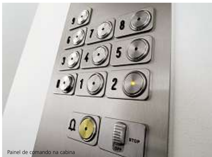
Painel de comando na cabina

Os painéis FI MXV oferecem ao passageiro funções lógicas e de fácil utilização. Cumprem com a regulamentação de segurança para ascensores existentes e são adequados para serem utilizados por deficientes, podendo ainda, ser equipados com inscrição em Braille como opção. É possível, também, instalar um microfone e um altifalante para uma ligação de emergência dedicada, 24 horas por dia.